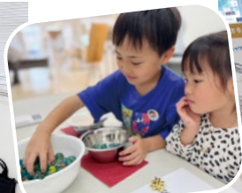
ちょうどぴったりの重さになるかな…