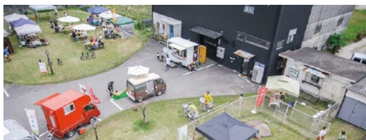
いろいろなお店が出店されました