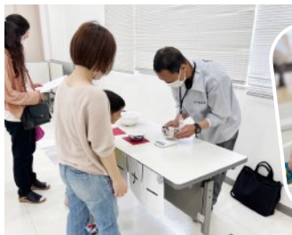
ビー玉の重さを測ってます♡

5/20(土)と5/21(日)の2日間、TOTO新居浜ショールームにて、水まわりリフォームフェアを開催いたしました☆両日ともに、たくさんのお客様にご来場いただき、スタッフ一同大変嬉しく思います！みなさまが、実際に新商品を手にとって体験されたり、楽しくミニゲームに参加されている様子が印象的でした♪今後も、さまざまなイベントを予定しておりますので、次回もご参加をお待ちしております！