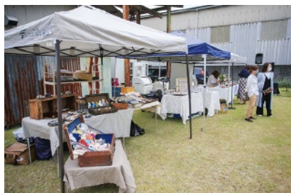
手づくりの雑貨屋さん