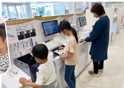
体験コーナーも人気です♪